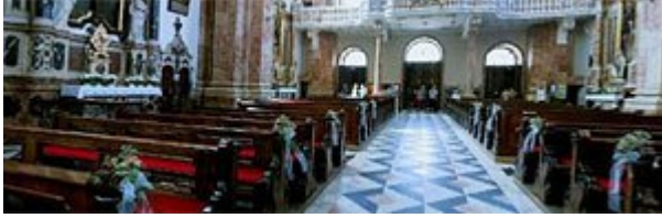
Dom zu St.Jakob