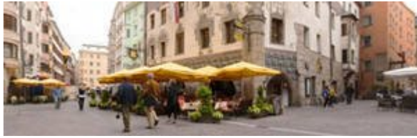
Goldener Adler und Ottoburg