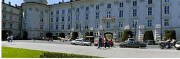
Kaiserliche Hofburg zu Innsbruck